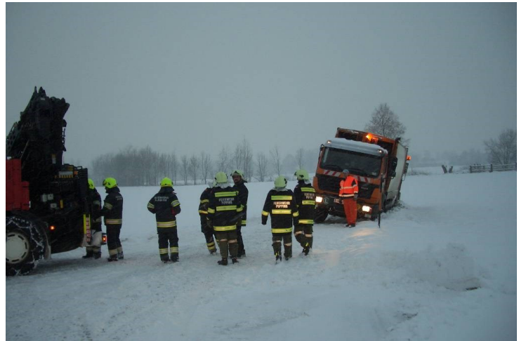
Fahrzeugbergung in Oberschaden