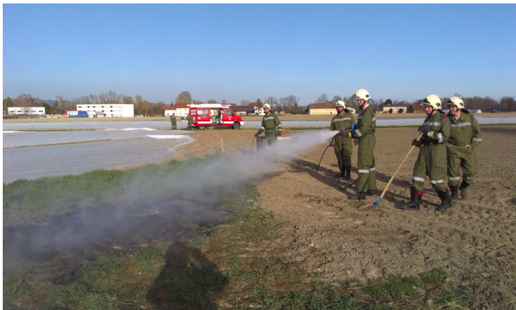
Flurbrand Au bei Hohensteg